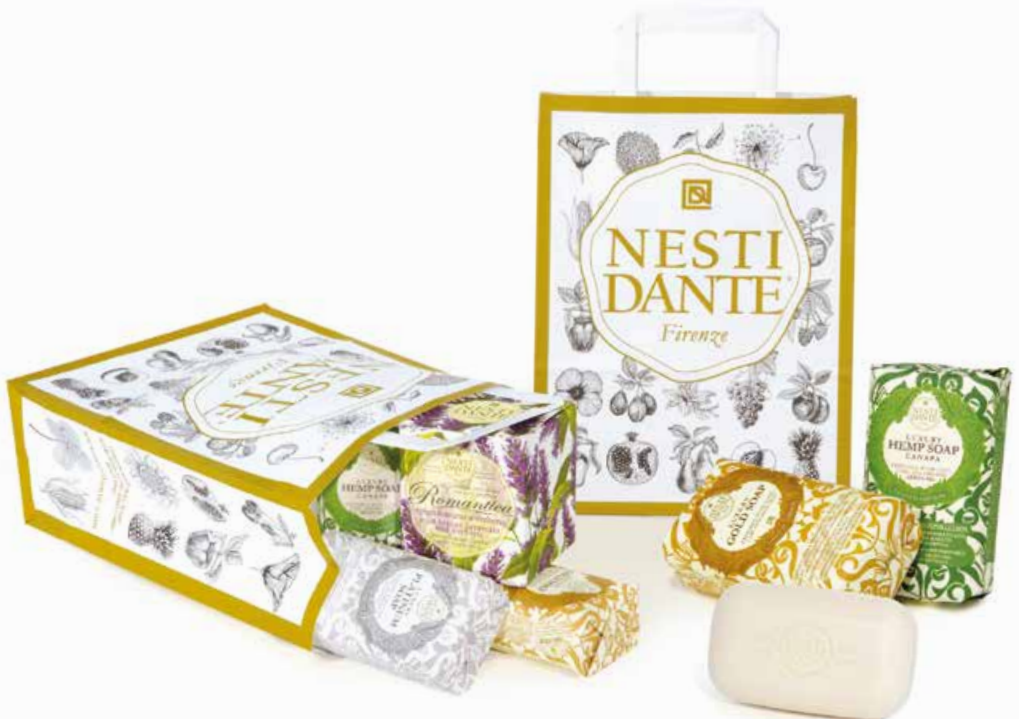
Shopping bag in carta bianca con stampa personalizzata White paper shopping bag with personalized graphics