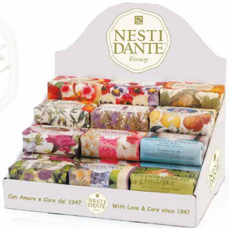
Espositore in cartone, contiene 30 saponi da 250 gr. Cardboard counter dispenser, contains 30 soaps x 250 gr./8.8 Oz